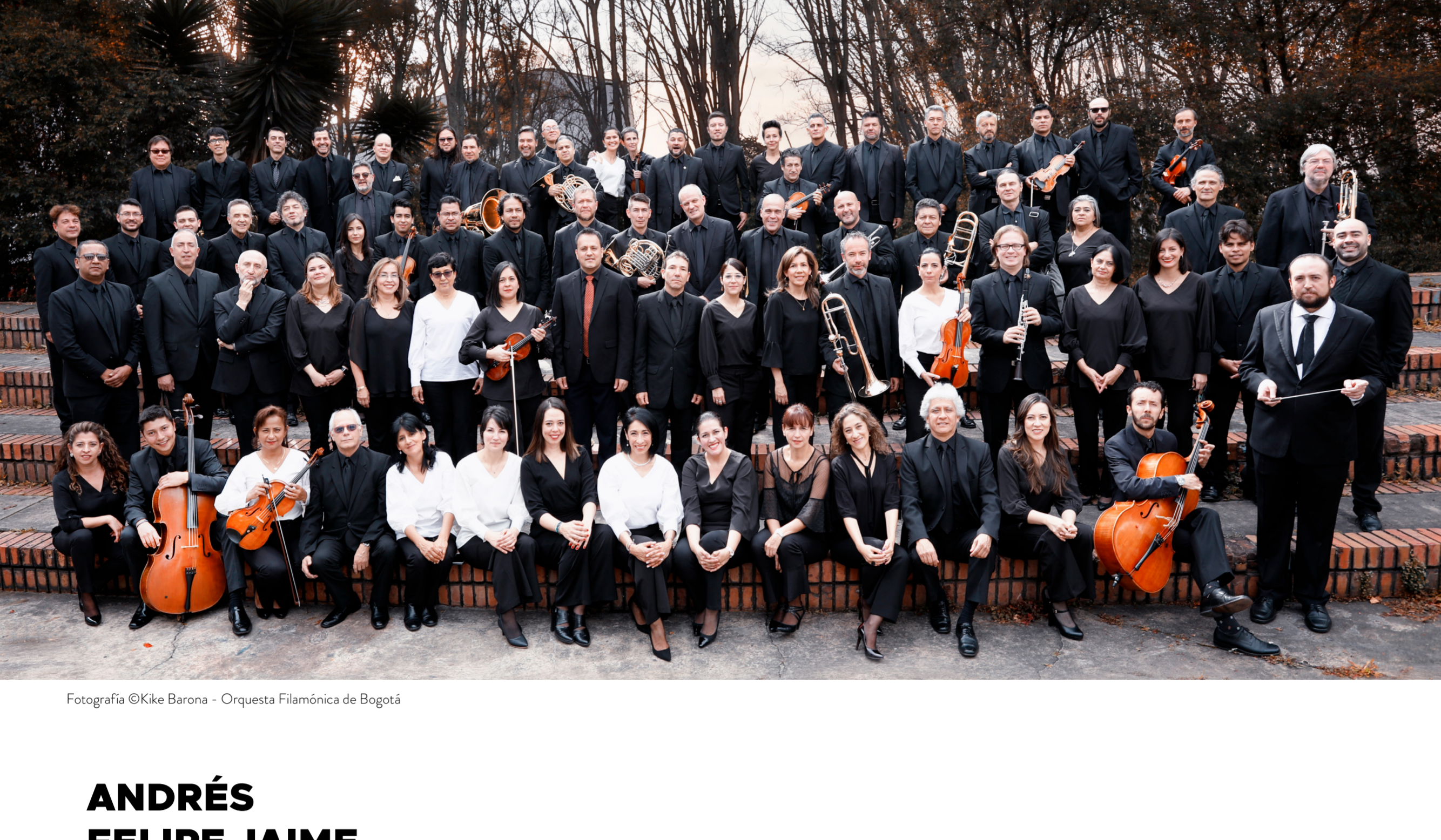
Fotografía © Kiko Barona - Orquesta Filarmónica de Bogotá

pelados, entre otros, ha conquistado nuevos públicos. Actualmente, adelanta el programa de formación a músicos jóvenes, que busca la excelencia a nivel profesional e interpretativo, y el Proyecto Educativo que cuenta con más de 20 mil niños y adolescentes entre los siete y los diecisiete años que reciben formación filarmónica. La Orquesta Filarmónica de Bogotá se destaca por interpretar obras de gran magnitud en escenarios convencionales y no convencionales.