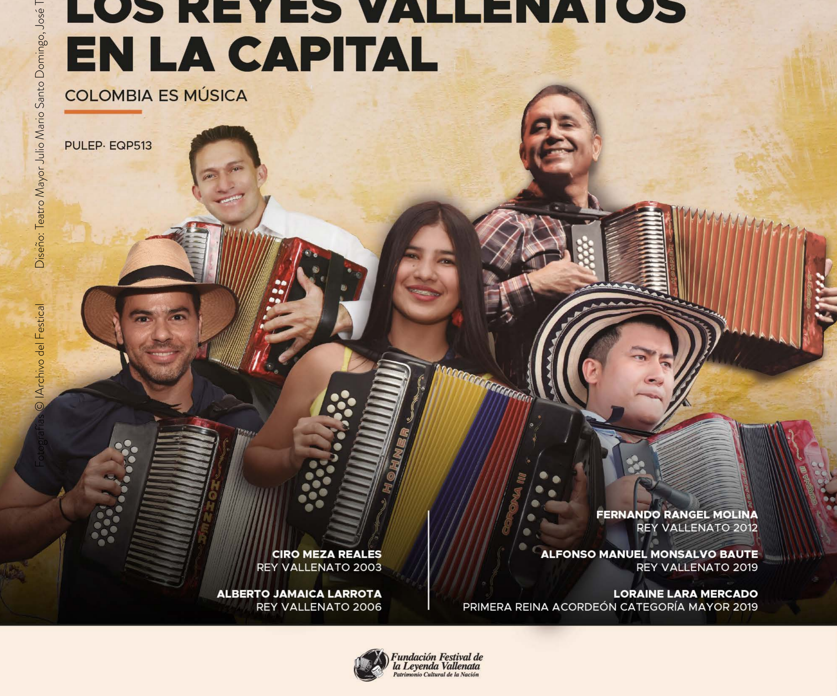
CIRO MEZA REALES REY VALLENATO 2003