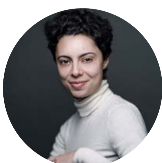
ORCHESTRE DES CHAMPS-ÉLYSÉES