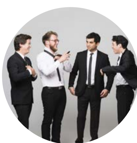
CUARTETO VAN KUIJK