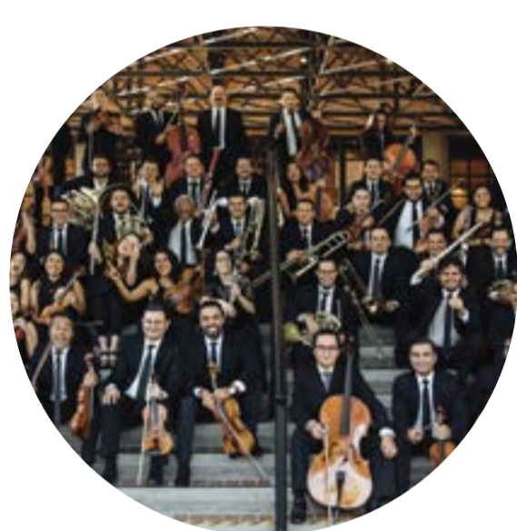
ORQUESTA FILARMÓNICA DE MEDELLÍN