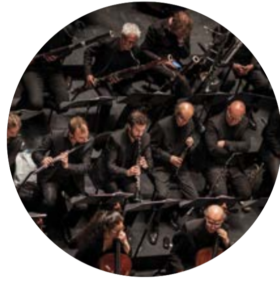
ORCHESTRE DES CHAMPS-ÉLYSÉES